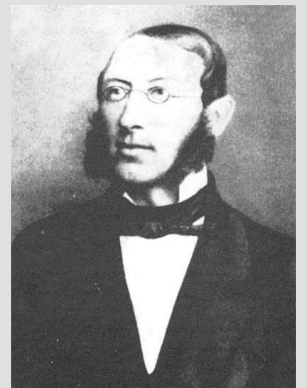
Georg Weerth (1822-1856)

Grabbe-Gesellschaft e.V. Bruchstr. 27 D-32756 Detmold