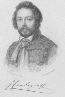
Ferdinand Freiligrath (1810-1876)