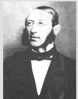
Georg Weerth (1822-1856)

Grabbe-Gesellschaft e.V. Bruchstr. 27 D-32756 Detmold