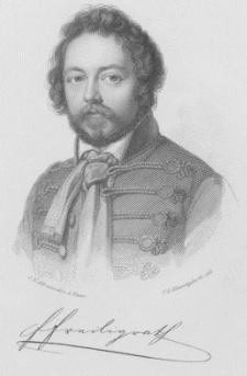
Ferdinand Freiligrath (1810-1876)