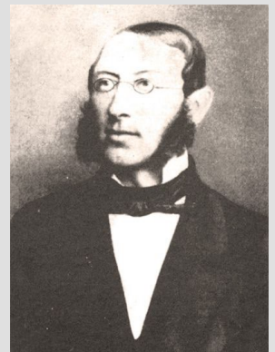
Georg Weerth (1822-1856)

Grabbe-Gesellschaft e.V. Bruchstr. 27 D-32756 Detmold