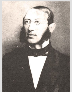
Georg Weerth (1822-1856)

Grabbe-Gesellschaft e.V. Bruchstr. 27 D-32756 Detmold