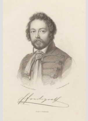
Ferdinand Freiligrath (1810-1876)